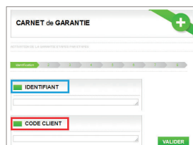
Identifiant et code

Vous nous trouvez pas votre étiquette Baticoch ? N'hésitez pas à contacter votre artisan qui pourra vous orienter.