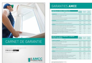
Carnet de garantie