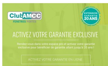
Écran d'activation de la garantie