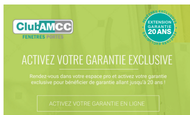
Écran d'activation de la garantie