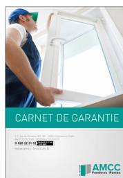
Carnet de garantie