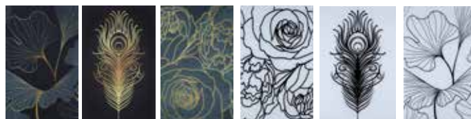
Vitrages créateurs imprimés et imprimés RAL